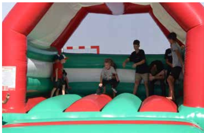
Nesměla chybět zábava pro děti - Skákací hrad