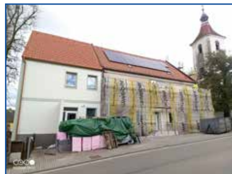
Probíhající práce na zateplení obecního úřadu