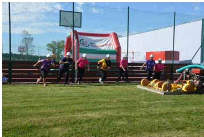
Družstvo žen na startu