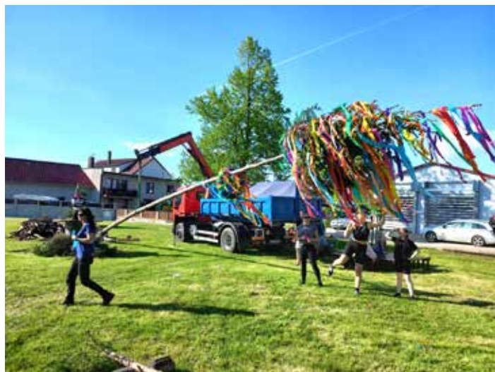
Stavění krásně nazdobené májky