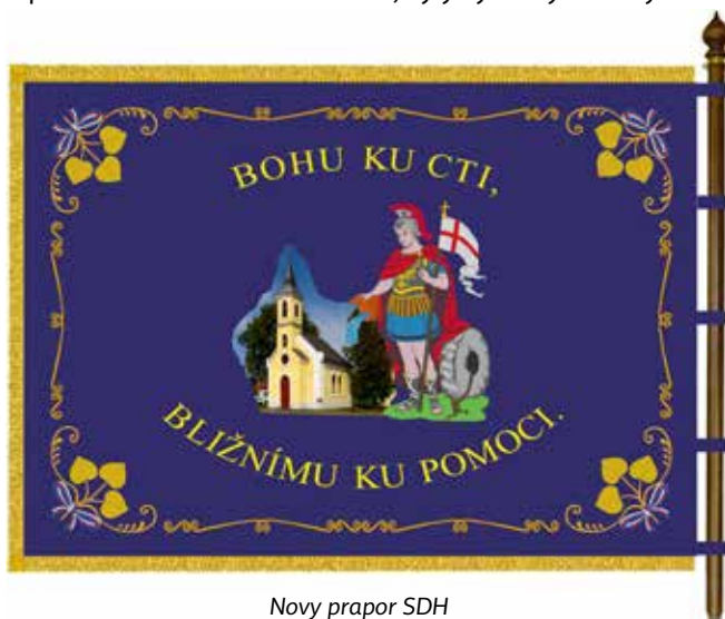
Nový prapor SDH