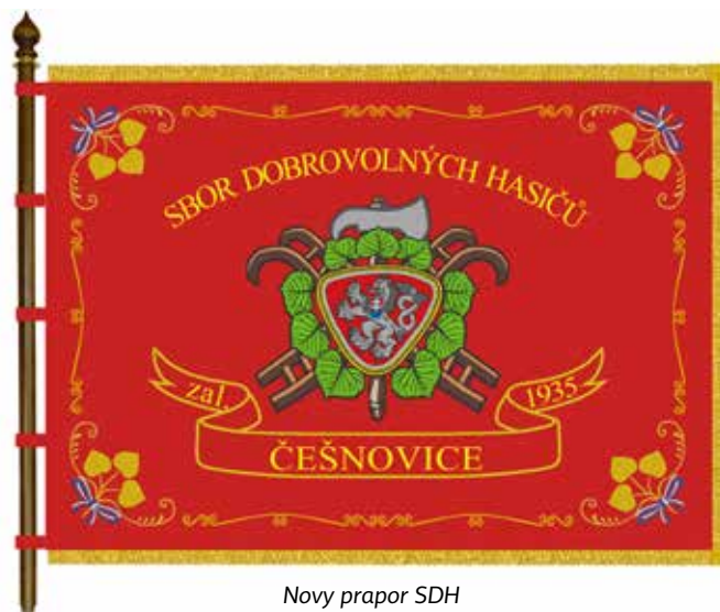
Nový prapor SDH