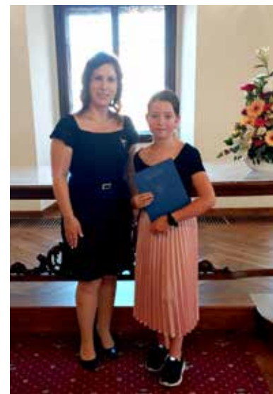
Primátorka Dagmar Škodová Parmová při předávání pamětního listu a dárku.