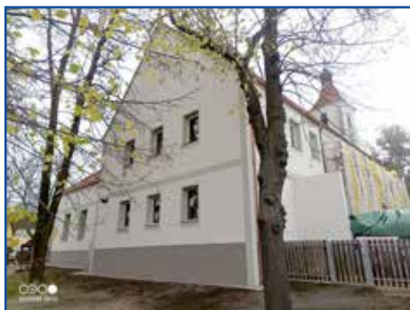
Nová budova MŠ