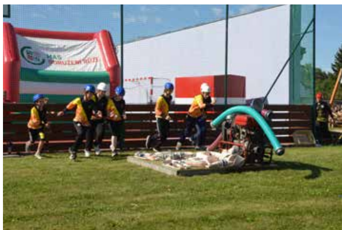
Družstvo starších dětí na startu