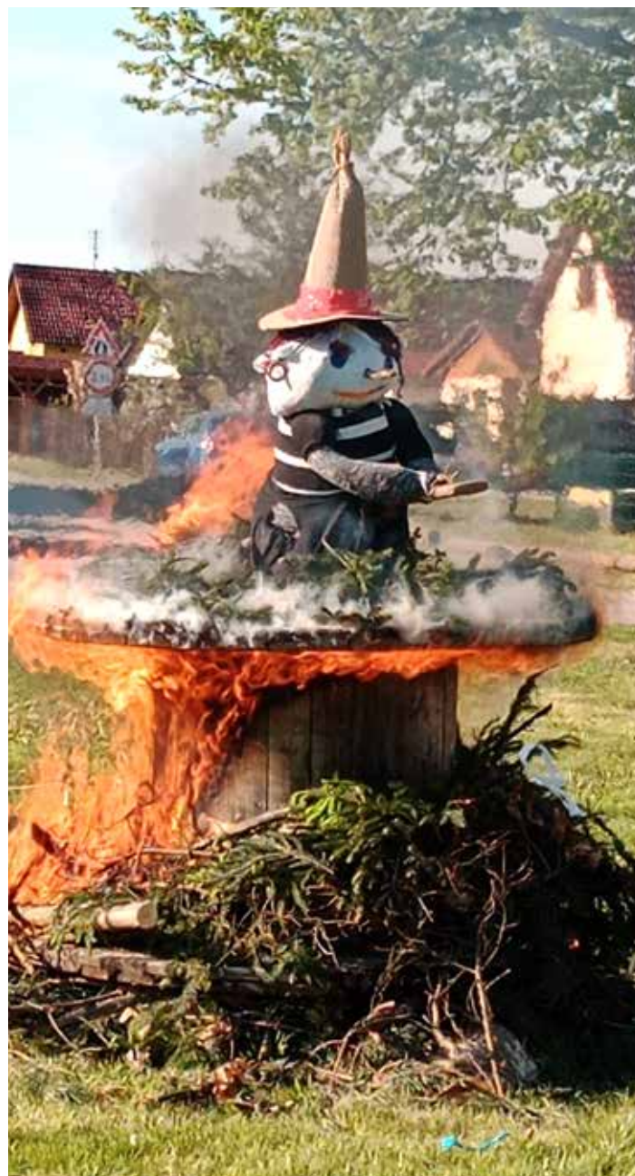
Čarodějnice to měla spočítané