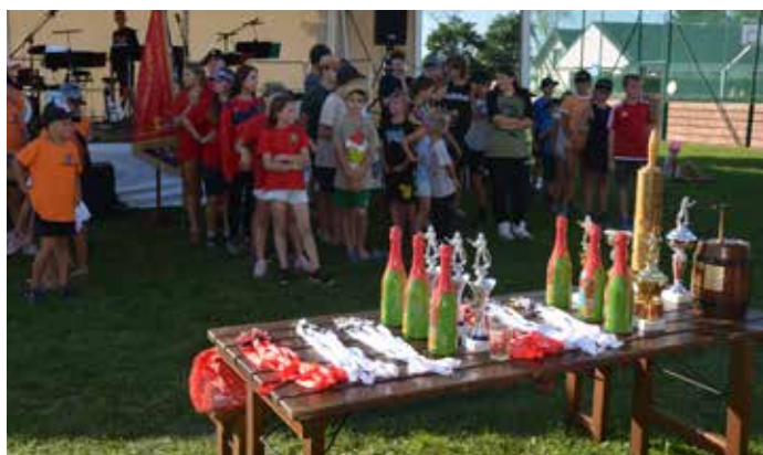
Vyhlášení soutěže dětí

Určitě vás bude zajímat větší množství fotografií z akcí.