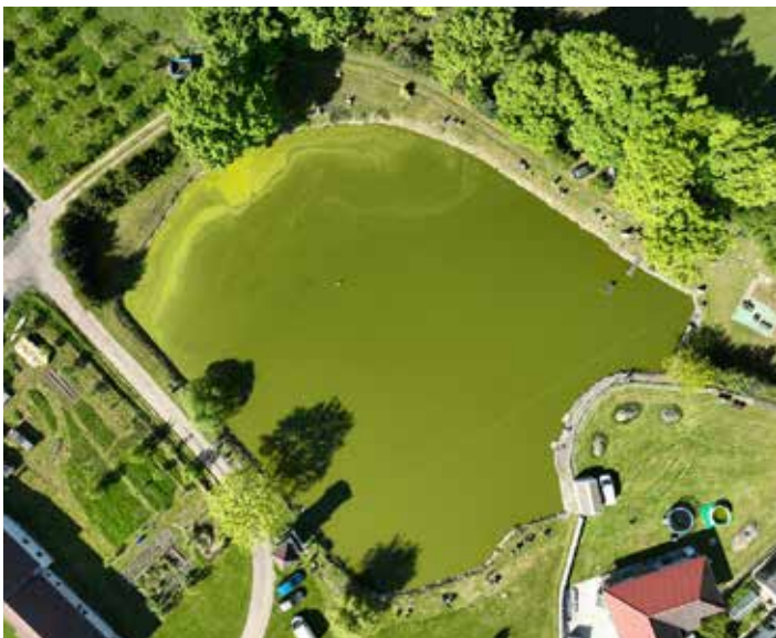
Pašický rybníček vyfocený dronem