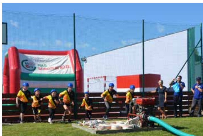
Družstvo mladších dětí na startu