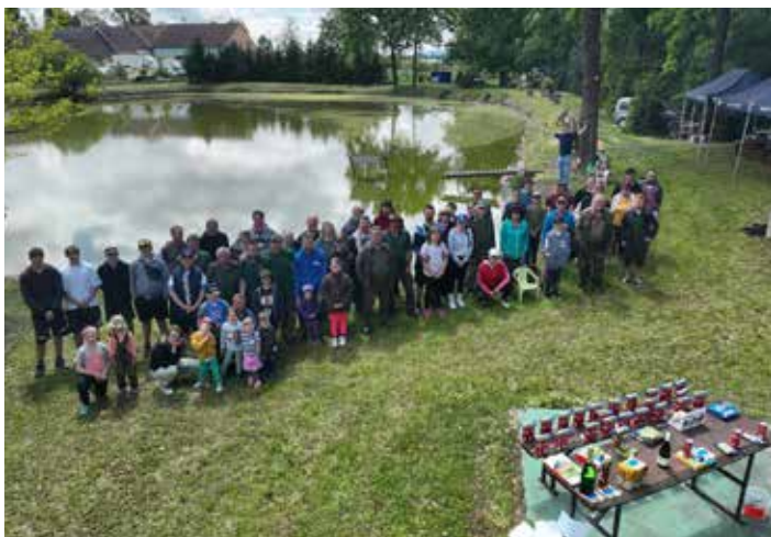
Hromadná fotografie z dronu

V neděli 11. května zavítalo do Pašic slunečné počasí a s ním i skvělá atmosféra u místního rybníčku, kde se konaly první letošní rybářské závody pořádané Rybářským klubem. Do akce se zapojilo 55 účastníků – 22 dětí a 33 dospělých, což svědčí o tradici i velké oblíbenosti.