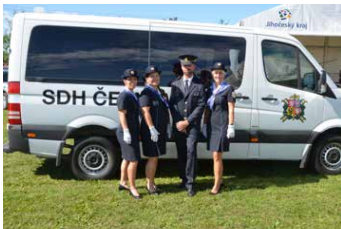
Nový vůz pro SDH