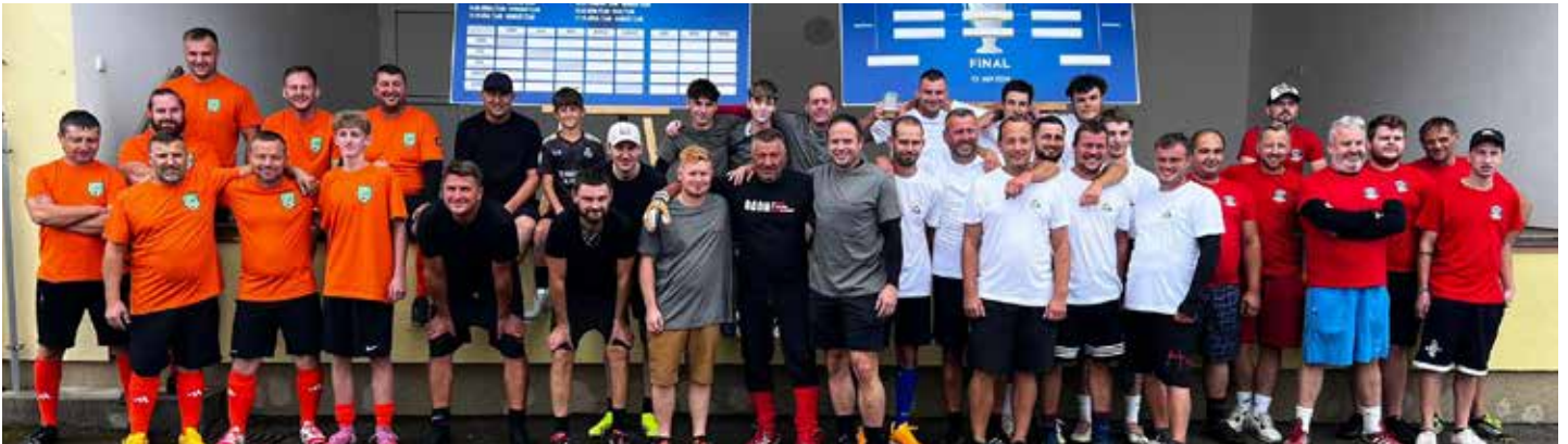
Hromadná fotka všech týmů

V sobotu 13. září ožil sportovní areál v Pištíně mimořádnou akcí. Konal se zde historicky první ročník fotbalového turnaje podnikatelů, který přilákal nejen pět odvážných týmů, ale také pár desítek fanoušků. Patronát nad turnajem převzal Rybářský klub Pašice, protože hned čtyři z pěti kapitánů jsou jeho aktivními členy.