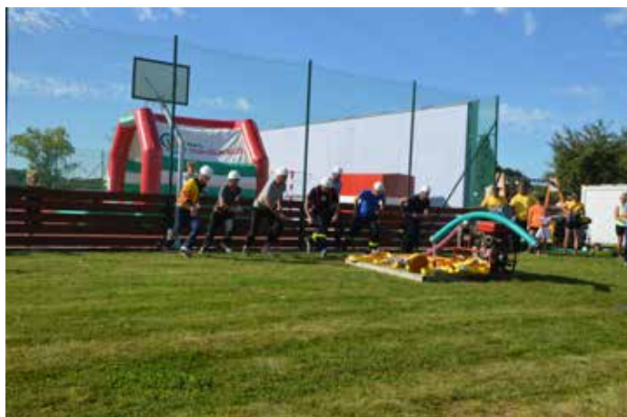
Družstvo mužů na startu