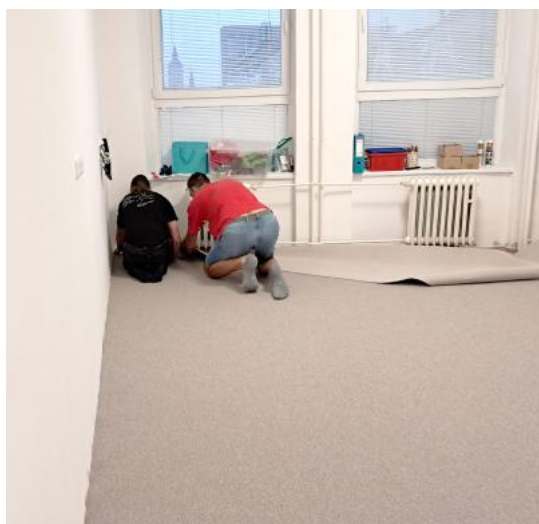
Začalo to pěkně od podlahy ...