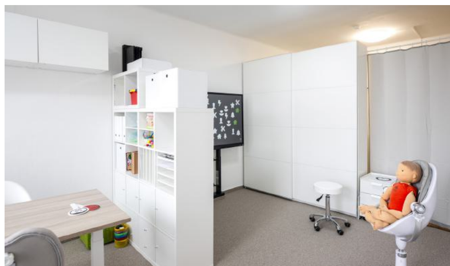
pokračovalo montáží mobiliáře ...